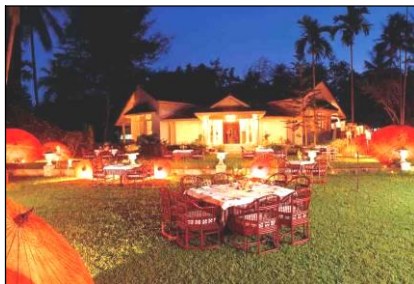
Restaurante Le Plantear

Este magnífico restaurante dirigido por un suizo con una amplia experiencia ha ganado múltiples premios y es reconocido como el mejor establecimiento del país.